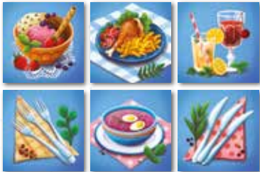
Počáteční rozložení kartiček hráče

Kartičky rozdělíme do skupin podle druhů – zvláště nože , zvláště vidličky atd. Takto rozdělené součásti servisu otočíme čistou stranou vzhůru a důkladně je v jednotlivých skupinách promícháme. Každý hráč obdrží jednu kartičku od každého druhu a položí si ji před sebe, aniž by se podíval nebo ukázal ostatním, co je na jejím rubu. Rozmístění kartiček musí být vždy stejné, a to v pořadí dezert, hlavní chod, nápoje a ve druhé řadě vidličky, polévka, nože .